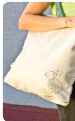
TYP: Nákupná taška MATERIÁL: sedlárske plátno APLIKÁCIA: kresba ROZMER: 39x39 cm