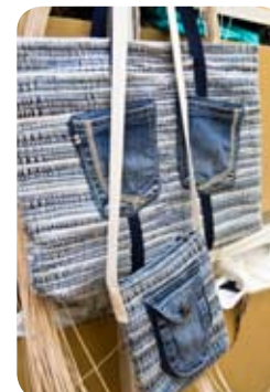
TYP: plážová taška ROZMER: 43x35 cm