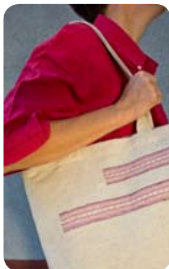
TYP: nákupná taška MATERIÁL: sedlárske plátno APLIKÁCIA: paličkovaná čipka ROZMER: 39x39 cm