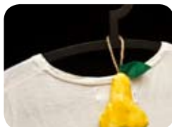
TYP: vrecúško plnené levandulou VRCHNÝ MATERIÁL: bavlna VÝPLŇ: polyester a bio levanduľa ROZMER: cca 11x8 cm