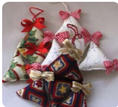
TYP: dekorácie MATERIÁL: kombinácia bavlnených textílií ROZMER: cca 10x10 cm