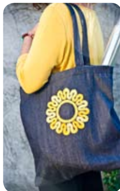
TYP: nákupná taška MATERIÁL: Riflovina APLIKÁCIA: paličkovaná čipka ROZMER: 39x39 cm