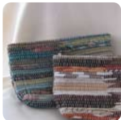
TYP: vrecúško na zips ROZMER: 20x13 cm