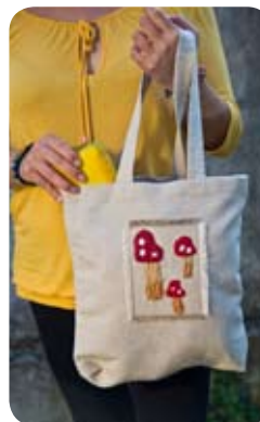
TYP: detská taška MATERIÁL: sedlárske plátno APLIKÁCIA: výšivka ROZMER: 35x32 cm