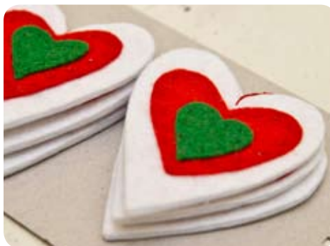
TYP: srdiečko (vianočná ozdoba) MATERIÁL: filc ROZMER: 21x10 cm