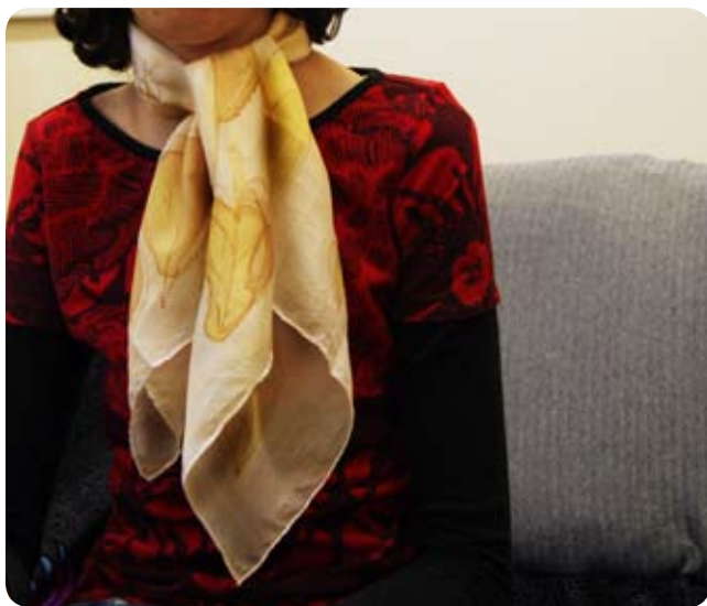
TYP: šatka MATERIÁL: hodváb ponge 05 ROZMER: 55x55 cm