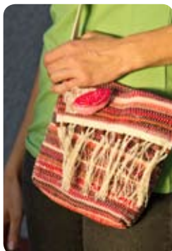
TYP: malá taška ROZMER: 20x18 cm