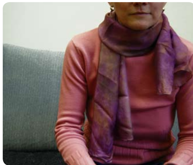
TYP: šál MATERIÁL: hodváb ponge 05 ROZMER: 130x30 cm