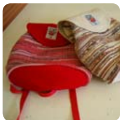
TYP: plecniak ROZMER: 40x43 cm