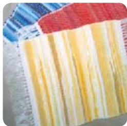
TYP: prestieranie ROZMER: 30x40 cm