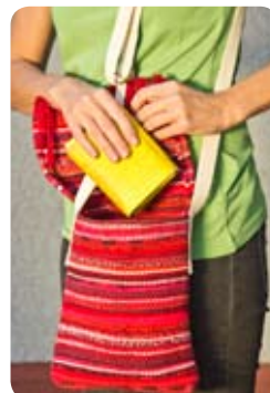
TYP: stredná taška ROZMER: 25x22 cm